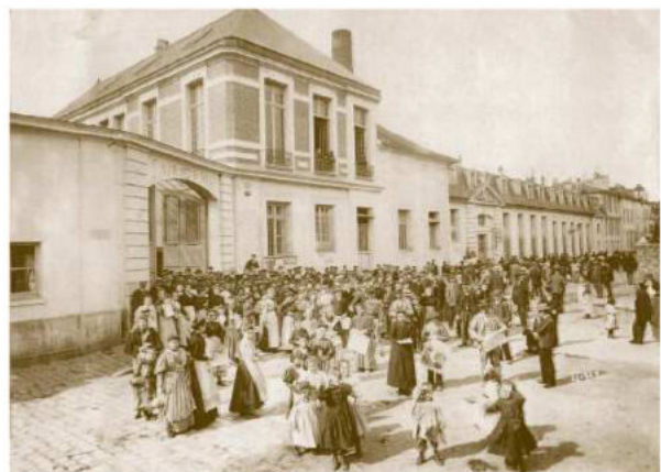
Entrée de la faïencerie.