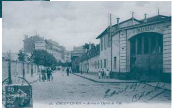
Entrée de la faïencerie Hippolyte Boulenger & Co. Carte postale - Collection archives municipales.

La fabbrica di ceramica di Choisy-le-Roi , conosciuta con il nome " Terracotta di Boulenger ", è stata fondata, nel 1804 , dai fratelli Paillart . L'anno di fondazione