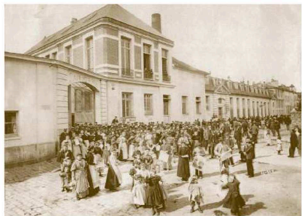
Entrée de la faïencerie.