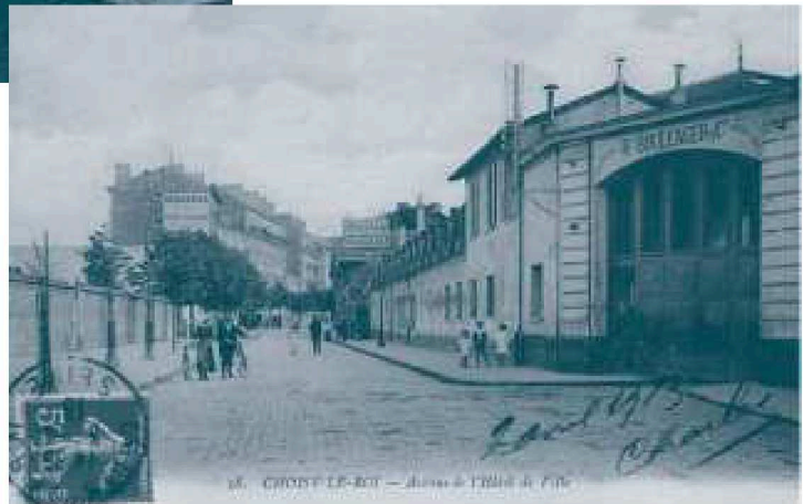
Entrée de la faïencerie Hippolyte Boulenger & Co. Carte postale - Collection archives municipales.

La fabbrica di ceramica di Choisy-le-Roi , conosciuta con il nome " Terracotta di Boulenger ", è stata fondata, nel 1804 , dai fratelli Paillart . L'anno di fondazione