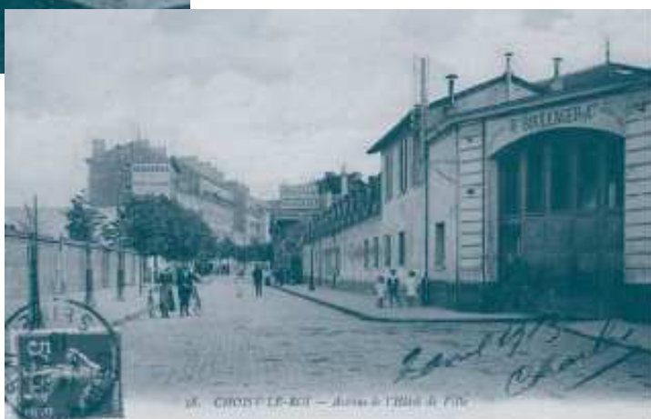
Entrée de la faïencerie Hippolyte Boulenger & Co. Carte postale - Collection archives municipales.

La fabbrica di ceramica di Choisy-le-Roi , conosciuta con il nome " Terracotta di Boulenger ", è stata fondata, nel 1804 , dai fratelli Paillart . L'anno di fondazione